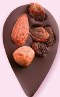
JULIETTE IN THE CITY Chocolat noir 60% de cacao, amande, noisette, raisins secs