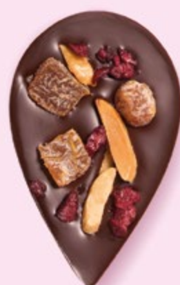
JULIETTE & TOM Chocolat noir 60% de cacao, dés d'abricots secs, amandes caramélisées et morceaux de cerise