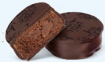
Ganache corsée de chocolat noir au cacao du Venezuela, chocolat noir 70% de cacao

Venezuela, Saint-Domingue, Équateur, Sao Tomé... Une invitation au voyage vers les plus fameuses origines de cacao.