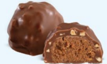
Praliné aux noisettes et éclats d'amandes, chocolat au lait 36% de cacao