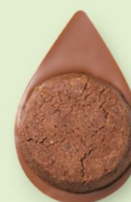
BISCUIT BROWNIE Chocolat au lait 35% de cacao

Les prix barrés sont les prix de vente TTC maximum en boutique. *Prix de vente TTC maximum.