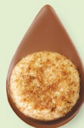
BISCUIT NOISETTES Chocolat au lait 35% de cacao

Un biscuit sablé artisanal posé sur un très bon chocolat ! C'est simple et c'est divin.