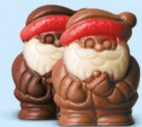
Duo praliné et caramel ou praliné et éclats de noisettes caramélisées