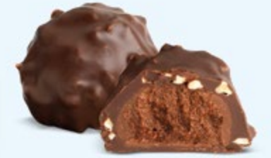
Praliné aux noisettes et éclats d'amandes, chocolat noir 60% de cacao

Éclats croustillants, praliné ultra fondant, finesse du chocolat d'enrobage... Les rochers sont les grands classiques de notre maison.