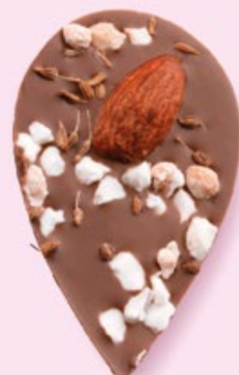
LE SONGE DE JULIETTE Chocolat au lait 35% de cacao, amande, éclats de nougat, brins d'anis