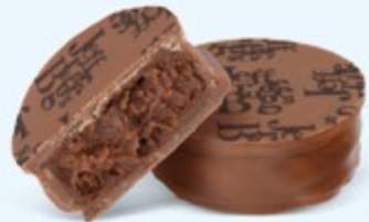
Ganache de chocolat noir au cacao fruité de Saint-Domingue, chocolat au lait 36% de cacao