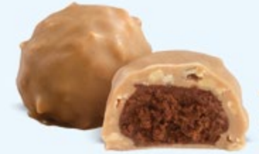
Praliné aux noisettes et éclats d'amandes, chocolat blanc caramélisé