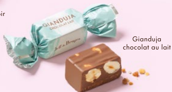
Gianduja chocolat au lait