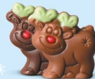
Praliné et éclats de noisettes torrifiées ou praliné et éclats de crêpe dentelle