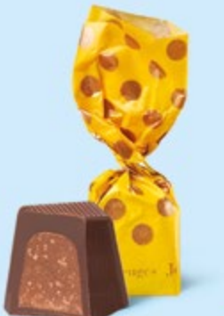
CHOCOLAT NOIR Praliné avec éclats de crêpe dentelle

BOITE DE 245 G NET 19 SUJETS ASSORTIS AU PRALINÉ 7 RECETTES