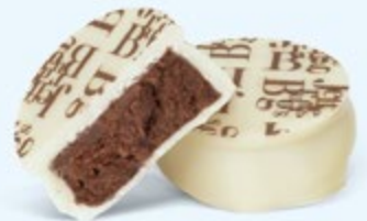
Puissante ganache de chocolat noir au cacao de Sao Tomé, chocolat blanc