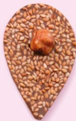
GRAINE DE JULIETTE Chocolat au lait 35% de cacao, sésame, noisette caramélisée