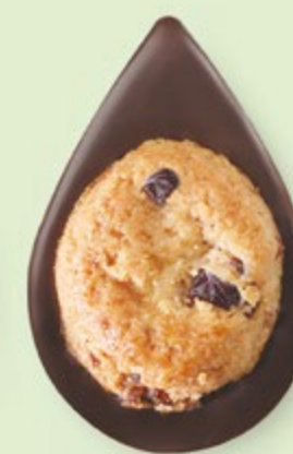
BISCUIT CRANBERRIES Chocolat noir 60% de cacao