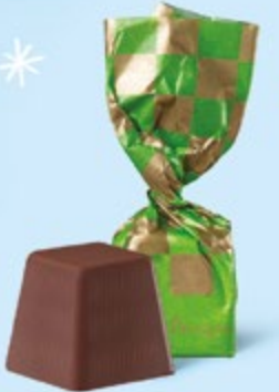
CHOCOLAT NOIR Praliné façon rocher aux éclats de noisettes