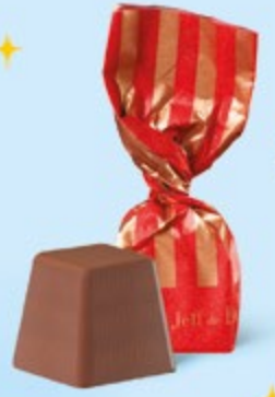
CHOCOLAT AU LAIT Praliné noisettes façon pâte à tartiner