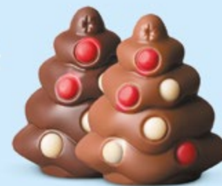
Praliné et sucre pétillant ou praliné et éclats de nougat

Nos choco'pralinés font partie de la magie de Noël. Ils plaisent aux petits... comme aux grands !