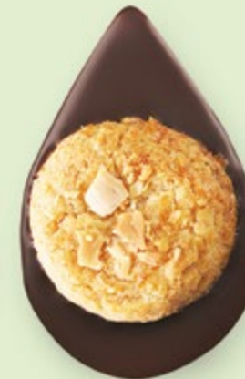
BISCUIT AMANDES Chocolat noir 60% de cacao