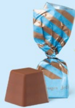
CHOCOLAT AU LAIT Praliné et sucre pétillant