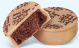
Ganache aromatique de chocolat noir au cacao d'Équateur, chocolat blanc caramélisé