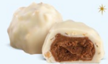
Praliné aux amandes et éclats d'amandes, chocolat blanc